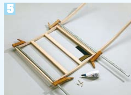
Verleimen und verdübeln Sie zuerst den Halter und anschließend die Bodenleisten. Wichtig: Auf rechte Winkel achten!