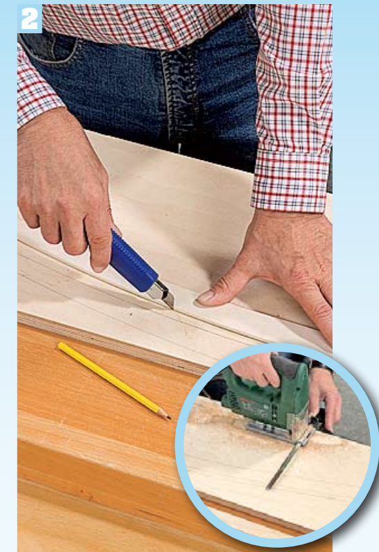
Die Schablone aussägen, Maße zweimal auf Multiplex übertragen, Maße zweimal auf Multiplex übertragen, mit dem Cutter anritzen und aussägen