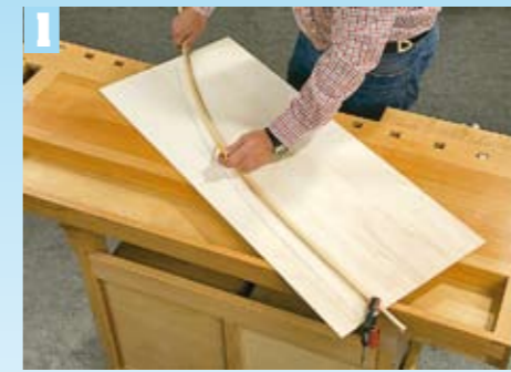
Fertigen Sie eine Schablone für die Seitenbögen mittels einer gebogenen Leiste und einer Sperrholzplatte an

FAZIT: Elegantes und stabiles Möbelstück für geräumige Badezimmer