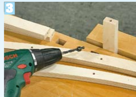
In die Seitenbögen und die zugeschnittenen Querleisten bohren Sie an den entsprechenden Stellen Sacklöcher