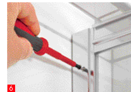
6 Ora potete infilare la parete doccia nei profili, allinearla e avitarla.