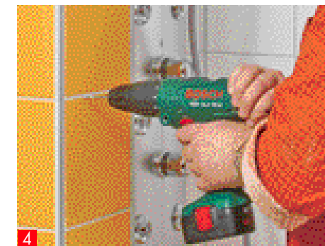
4 ... la posizione della parete doccia e i punti in cui effettuare i fori con il trapano per il montaggio dei profili di inserimento della parete. Appoggiate nuovamente la parete ...