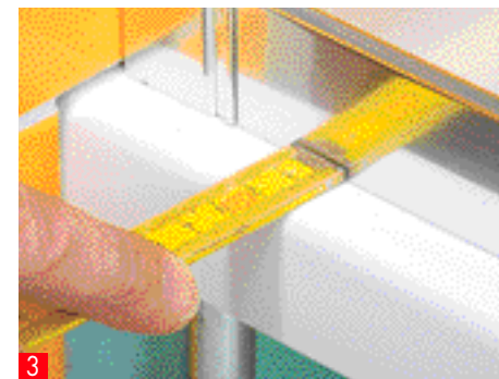
3 Misurate la distanza tra la parte esterna della parete doccia fino alla parte esterna della vasca secondo le istruzioni. Segnate quindi...