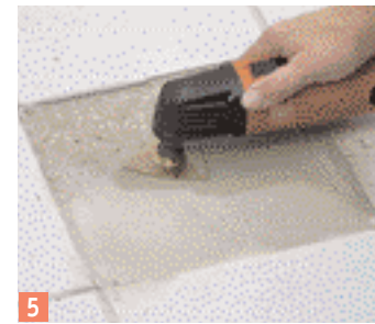
5 ... la spatule en métal dur et égalisez la surface.