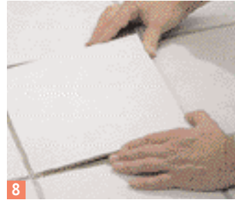
8 ... puis posez le nouveau carreau.