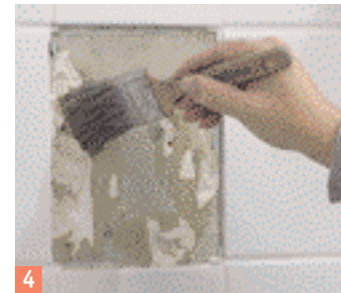
4 Egalisez la surface de la paroi, enduisez-la avec un apprêt, ...