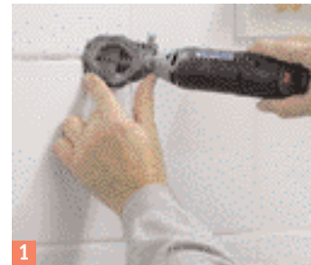
1 Le Dremel convient également bien pour évider les joints.

Le carreau est percé, les trous ne sont pas beaux; on peut les cacher avec un décor, mais encore mieux vaut remplacer le carreau.