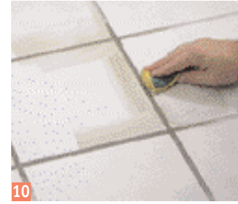
10 ... des joints. Nettoyez avec une éponge.