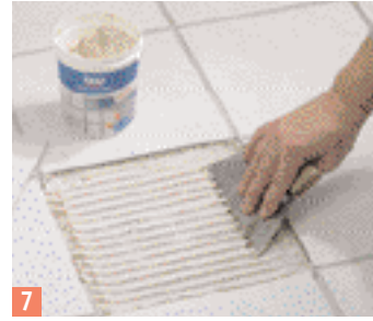
7 Appliquez la colle à carreau avec une spatule dentée...