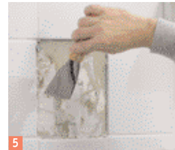
5 ... afin que le mastic de réparation colle bien.