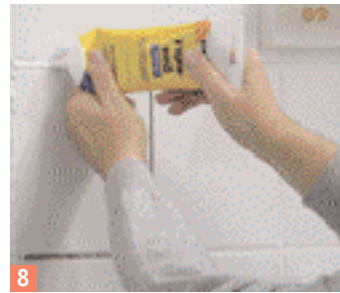
8 Si vous avez peu de joints à faire, utilisez une masse prête à l'emploi...