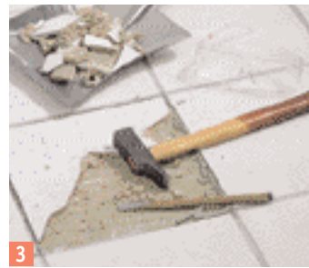
3 Avec un burin sortez le carreau.