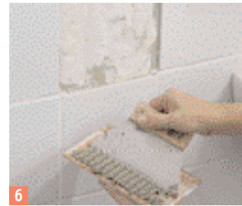
6 Lorsque le mastic est sec, enduisez le dos du carreau de colle.