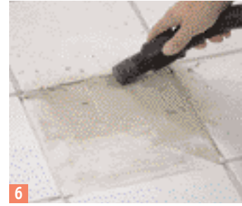
6 Enlevez les restes du carreau et de mortier avec un aspirateur