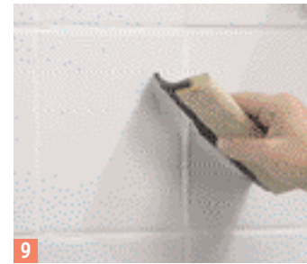
9 ...répartissez-la soigneusement avec un racloir en caoutchouc.