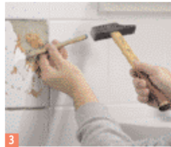
3 ... de le décoller au burin.