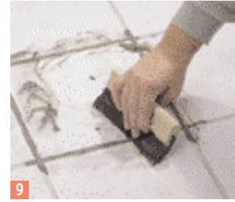
9 Avec un racloir en caoutchouc enlevez l'excédent de mortier...