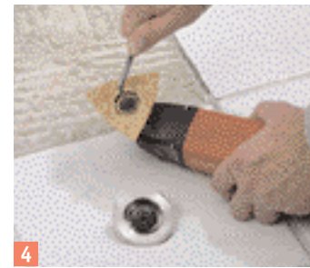
4 Remplacez le disque en métal dur contre ...