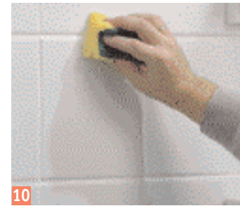
10 Enlevez la masse superflue avec une éponge.