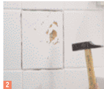
2 Ensuite cassez le carreau au marteau jusqu'à ce qu'il soit possible...