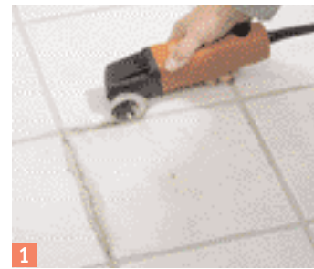
1 Avec le MultiMaster fin coupez tout d'abord le pourtour des joints.

Lorsqu'une bouteille de parfum tombe sur le sol, le carreau se casse plus fréquemment que la bouteille elle-même. Le remplacement du carreau s'impose.