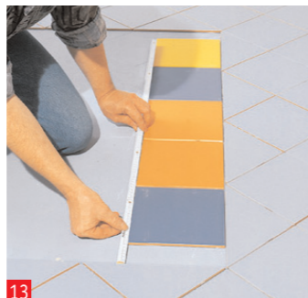
13 ...bisogna tagliare degli appositi pezzi di passaggio. La messa in posa delle piastrelle per gli intarsi inizia...