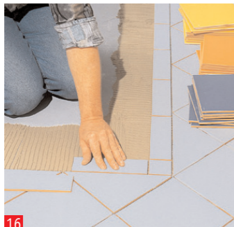
16 ... "prova a secco", mescolate il collante per piastrelle ed iniziate posando le piastrelle fini del bordo