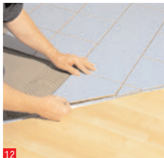
12 ...chiudano a fila. Presso le zone di collegamento con le altre stanze ciò non e' sempre possibile e...