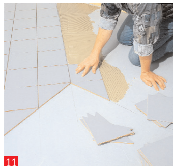
11 Anche la lunghezza degli intarsi dovrebbe venir misurata in questo modo, affinché le piastrelle posate diagonalmente...