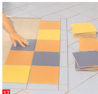
17 Dopodiché non dovrebbe esserci più alcun problema nel ricoprire la restante superficie con le piastrelle