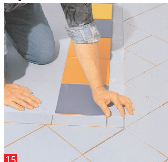
15 ...vanno tagliati anch'essi così come i pezzi ad angolo. Se tutto funziona nella ...