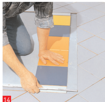
14 ...anche qui dapprima a secco. Come bordo abbiamo scelto dei pezzi di piastrelle fini. Questi...