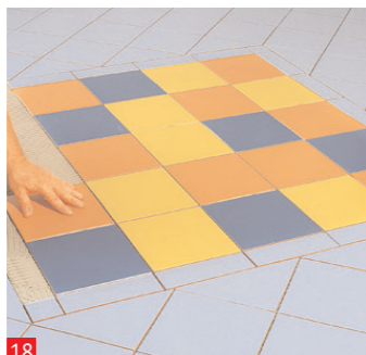
18 L' abbinamento dei colori va definito personalmente: anche un intarsio monocolore e' possibile