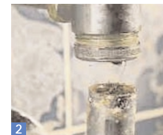
2 Nicht schön, aber wahr: Als wir versuchten, den U-Bogen zu lösen, kam er uns schon entgegen. Ein neues Rohrstück war fällig.