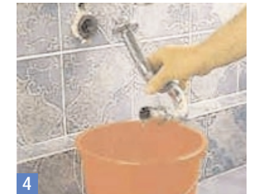
4 Den Siphon nicht hastig bewegen, da sich Sperrwasser im Rohr befindet. Entleeren Sie es in den bereitgestellten Eimer.