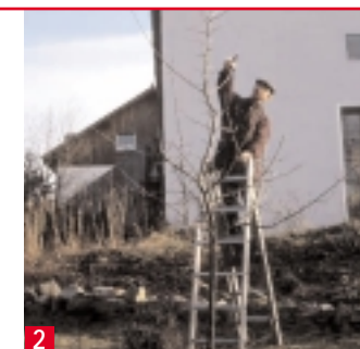
2 ... wieder müssen die Triebe zurückgeschnitten werden ...