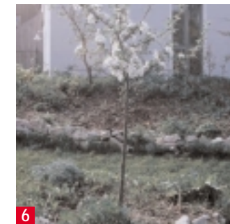
6 Mit der ersten Blüte wächst die Vorfreude auf eine reiche Ernte.