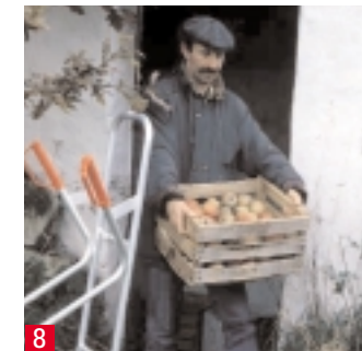
8 Trockene und kühle Lagerung der Ernte verspricht einen langandauernden Genuss.