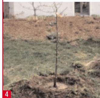
4 Der Wurzelhals, an einer deutlichen Verdickung am unteren Ende des Stammes zu erkennen, bleibt über dem Boden.