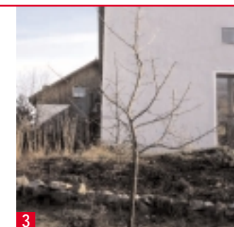
3 ... damit sie wieder kräftig austreiben und ein schöner Baum heranwächst.