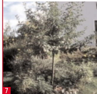
7 Der Fruchtstand hat sich gut herausgebildet.