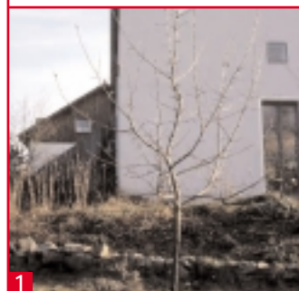
1 Das nächste Frühjahr steht vor der Tür...