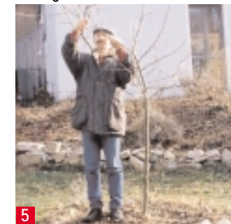
5 Im weiteren Verlauf des Wachstums störende Triebe für die gewünschte Formgebung entfernen.