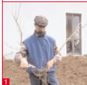
1 Die Wurzeln müssen gekürzt werden. Sonst wachsen sie schlecht oder gar nicht an.