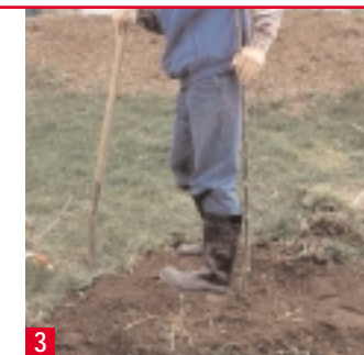
3 Nach dem Einsetzen die lose Erde durch Festtreten rund um den Wurzel-Ballen verdichten.