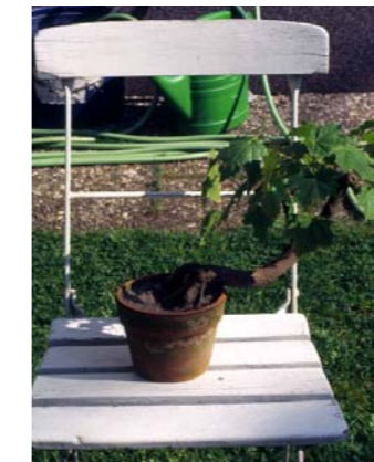
Erable plane en été avec tronc tordu

Souvent des petits arbres dont les graines ont été amenées par le vent ou des oiseaux poussent dans le jardin. Les pousses d'érable, de chêne, de saule ou de peuplier dérangent dans les carrés, par contre elles sont utiles en tant que bonsaïs. Pour cela, il faut déterrer les petits arbres en automne ou au printemps, puis les planter dans un beau bac; si nécessaire ils seront taillés. Ainsi ces jeunes plants peuvent être formés comme bonsaï.