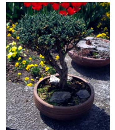
Un genévrier sous forme de bonsaï