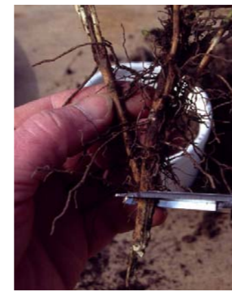
Les longues racines seront coupées d'un tiers ou de la moitié.