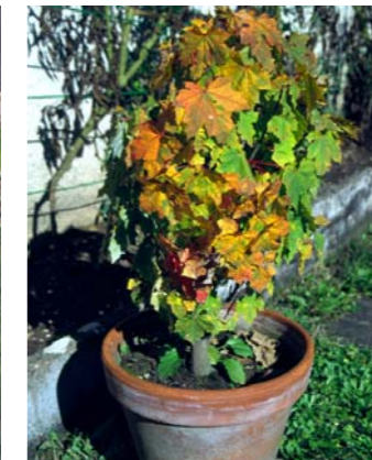
Erable plane en automne – les feuilles prennent les mêmes couleurs qu'un grand arbre.