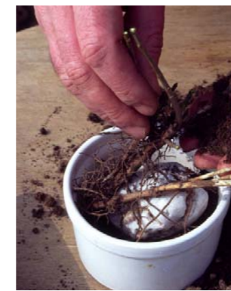
La plante sera placée dans un pot rempli de substrat à base de terreau.