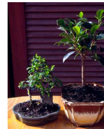
Bonsaïs Indoor - diverses variétés de ficus