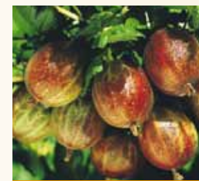
Groseilles à maquereau