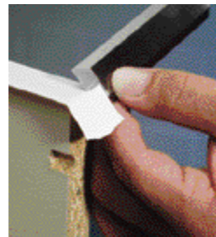
con uno scalpello da legno tagliare con cura i resti degli spigoli che fuoriescono.