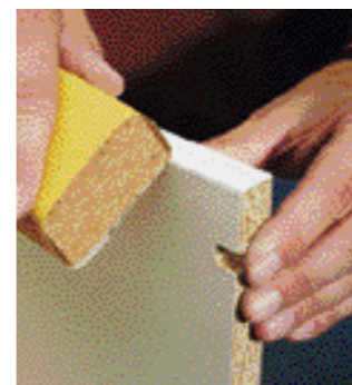
infine raddrizzare gli spigoli laterali con una bietta e arrotondarli leggermente.

Molto importante è mettere un asciugamano sotto come quando si stira. Ciò proteggerà sia il ferro da stiro che la superficie del bordo. Dopo aver riscaldato bene il vecchio bordo potrete toglierlo con precauzione iniziando dallo spigolo. Liberare la superficie rimanente da resti di adesivo. Stirare sul nuovo bordo con la stessa temperatura (ossia per il cotone). Quando è ancora caldo premere bene sul bordo