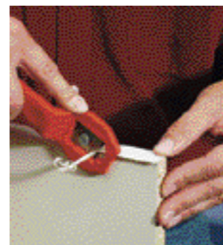
appianare i resti dei lati con una taglierina per bordi. Chi ne è in grado può usare la lima.