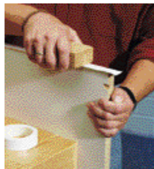
con cura premere sugli spigoli con un pezzo di legno, di modo che più tardi non possa staccarsi.