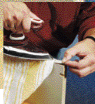
riscaldare il vecchio bordo con il ferro da stiro e contemporaneamente staccarlo iniziando dallo spigolo