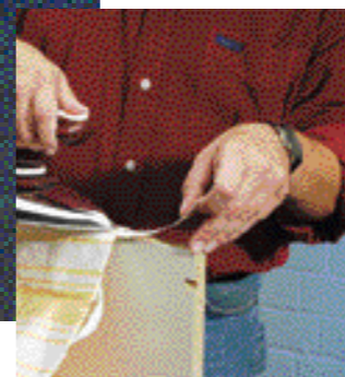
... passargli il ferro da stiro (temperatura: cotone), senza dimenticare l'asciugamani.