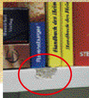
uno spigolo danneggiato non è un buon motivo per cambiare tutto il ripiano