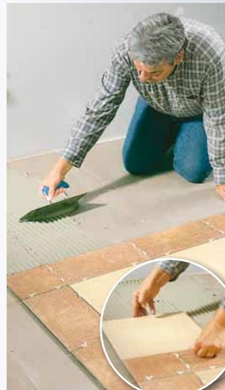
9 Ora viene piastrellata la superficie rimanente verso la parete. Nella nuova colla stesa posate...