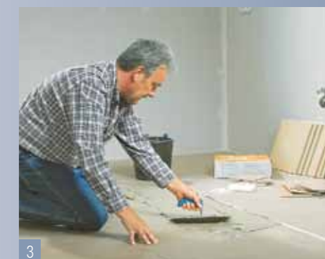
3 Individuate la posizione del campione con del nastro adesivo crespato. Stendete la colla lungo un lato mediante la cazzuola dentata.