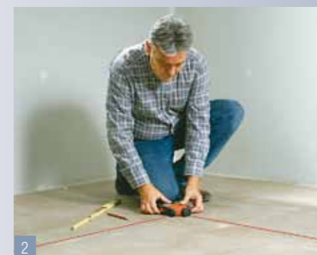
2 Nell'operazione di posizionamento aiutatevi con un laser: spostate eventualmente la posizione in modo che nessuna piastrella intera rasenti la parete.