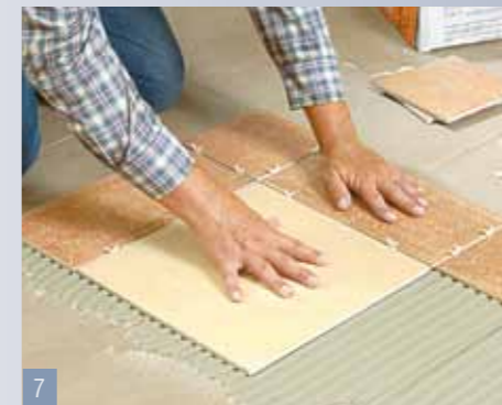
7 ...rimuoverle facilmente e a riutilizzarle. Premete nella colla le piastrelle della 2ª fila, posizionandole l'una accanto all'altra.