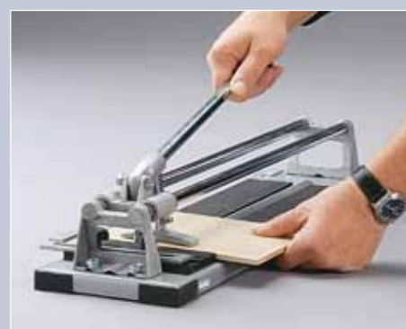
Posizionate il punzone di rottura in corrispondenza del bordo anteriore e abbassate la leva in modo regolare.