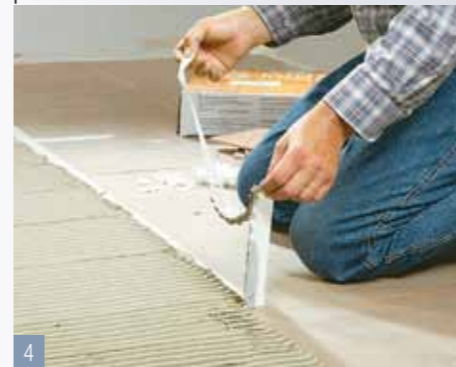
4 Rimuovete il nastro crespato lungo questo lato. Il limite della colla funge ora da bordo di riferimento.