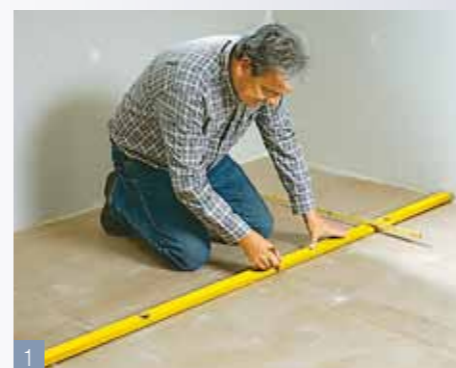
1 Demarcate la posizione desiderata per l'isola di piastrelle. Orientate adeguatamente tutte le altre piastrelle.