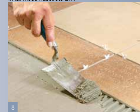
8 Per poter piastrellare successivamente l'intera superficie, è assolutamente necessario rimuovere la colla in eccesso sul bordo.