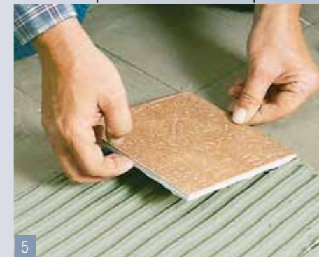
5 Premete ora le piastrelle di bordura nella gettata di malta. Con i quadrati iniziate negli angoli –...