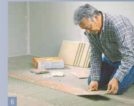
6 ...poi procedete fra questi con i formati rettangolari. Inserite di taglio le crocette distanziatrici per fughe, in tal modo riuscite a...