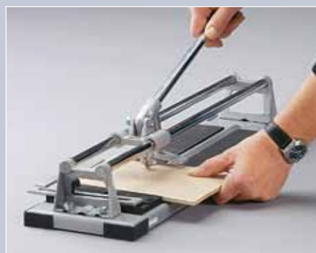
La pressione sulla leva spinge la rotella di taglio sulla piastrella, scalfandone la superficie smaltata.

Innanzitutto: anche ai professionisti, non tutti i tagli effettuati con il tagliapiastrelle riescono bene. All'acquisto delle piastrelle mettete in conto scarti e rotture. Cionondimeno: con il tagliapiastrelle riuscirete a dividere la maggior parte delle piastrelle con sufficiente precisione. Le piastrelle si spezzano su un punto di rottura teorico che intagliate mediante una rotella d'acciaio affilata che agisce sullo smalto della piastrella. La fragilità del materiale provoca la rottura della piastrella lungo questa linea.