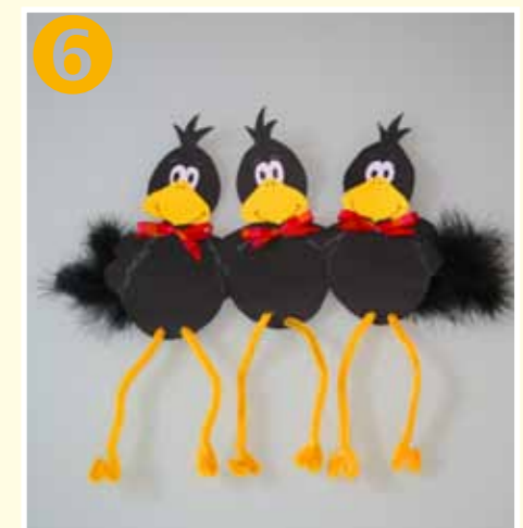
Bild 6 Aiutandosi con il filo di nylon, preparare un fiocco con il nastro decorativo e incollarlo sui colli dei corvi. Dal filo armato di ciniglia giallo dorato ritagliare dei pezzetti lunghi circa 20 cm e creare i piedi piegando il filo a «W». Incidere i corpi dei corvi e infilare le gambe che andranno fissate sul retro con della colla a caldo. Applicare dal dietro le piume marabù ai due corvi esterni, come fossero penne della coda.