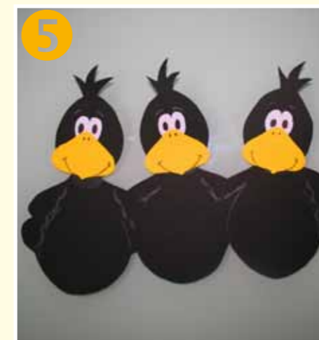
Bild 5 Incollare le teste sui corpi dei corvi. Intagliare le ali del corvo centrale e inserire in questa incisione le ali dei due corvi esterni. Incollare i corpi dei corvi l'uno accanto all'altro. Disegnare e tratteggiare con la matita colorata bianca i contorni. Con il pennarello a smalto bianco creare dei punti di luce negli occhi.