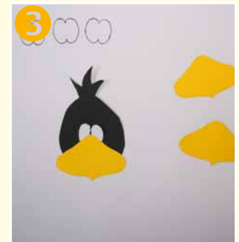
Bild 3 Preparare gli occhi dei corvi con il cartoncino bianco.