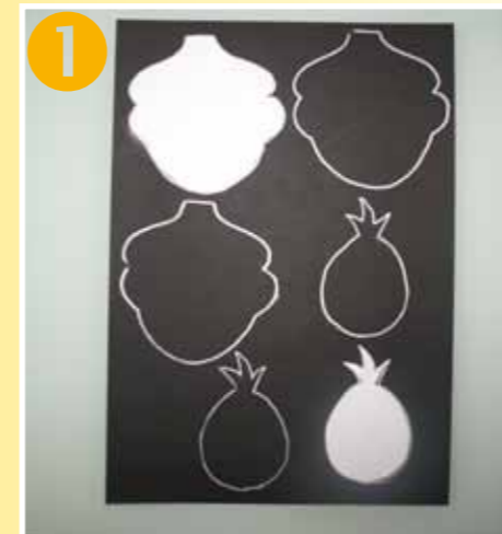
Bild 1 Disegnare sul cartoncino colorato tre corpi e tre teste dei corvi. Il modo migliore per farlo è preparare un modello. Ritagliare le parti.