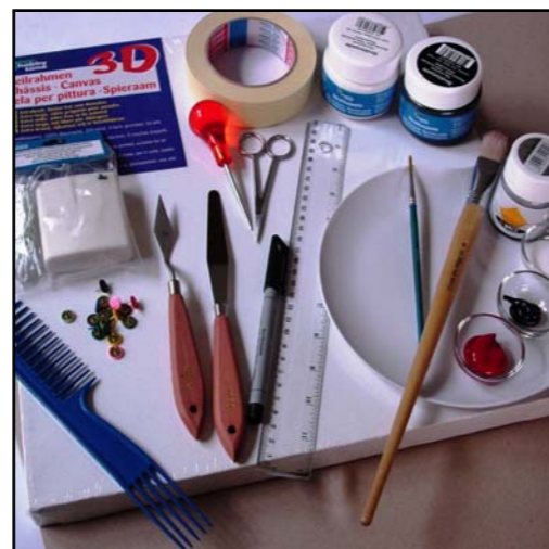
Tableau asiatique sur châssis toilé